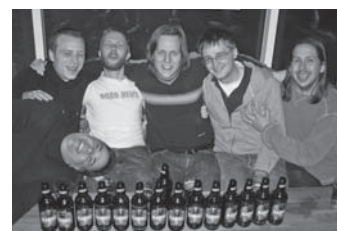
Vi har visserligen data på jobbet men ingen Björn-öl, skrockar hela Björnligan.

dricker Björn-öl. Det ryktas även att flera av dem skulle vara medlemmar av någon hemlig björnklubb. Dessa rykten är dock obekräftade.