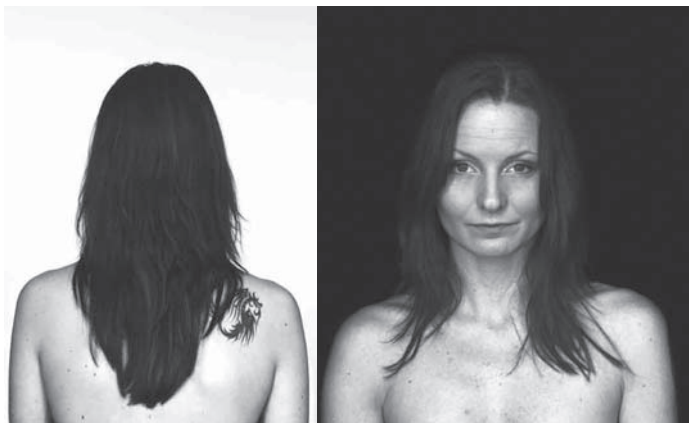
Frida brukar vanligen hänga på fel sida i baren. Numera hänger hon i fönstret också.