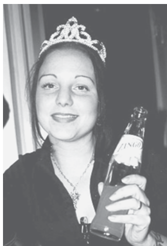
Sverige är gasbollärt, men Afrika är gasbollärare